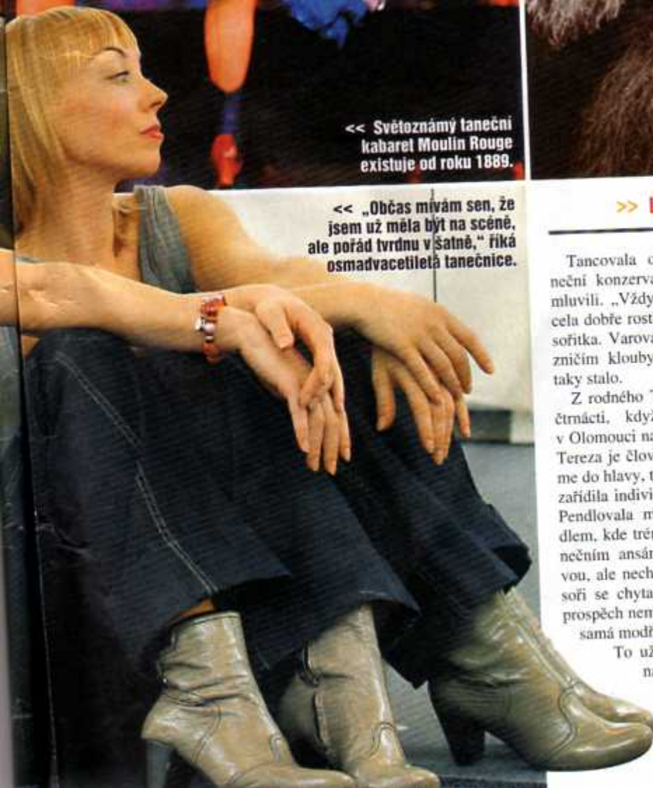
<< „Občas mívám sen, že jsem už měla být na scéně, ale pořád tvrdnu v šatně,“ říká osmadvacetiletá tanečnice.