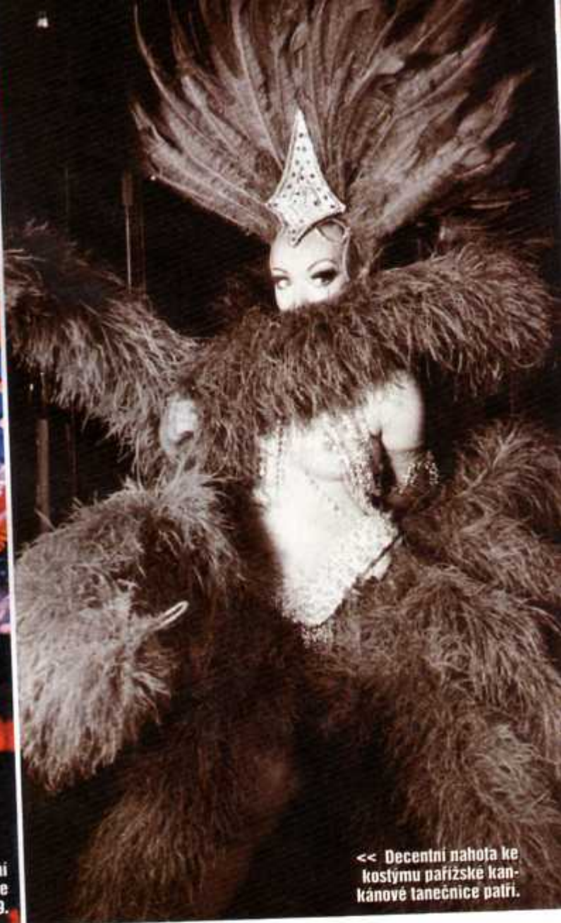
<< Decentní nahofa ke kostýmu pařížské kan-kánové tanečnice patří.