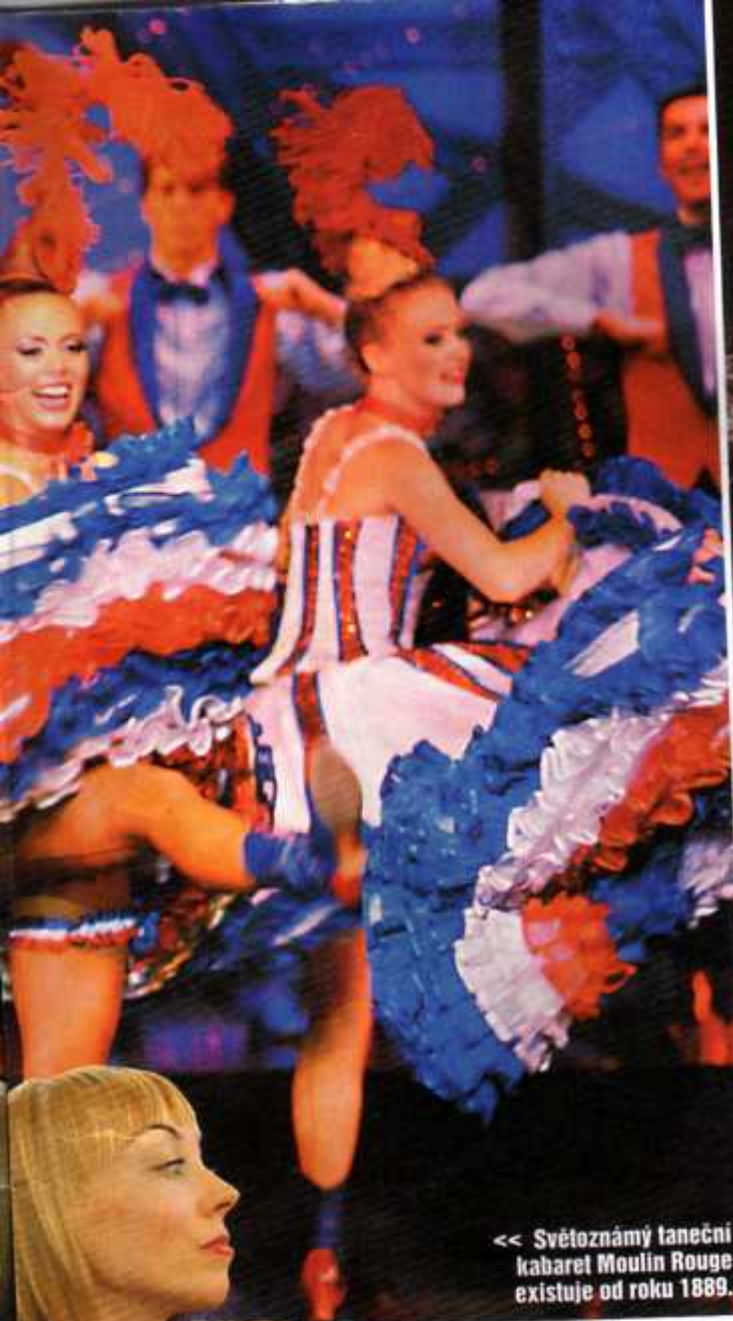
<< Světoznámý taneční kabaret Moulin Rouge existuje od roku 1889.