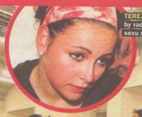
TEREZA se priznala, že by raději dala přednost sexu než józe